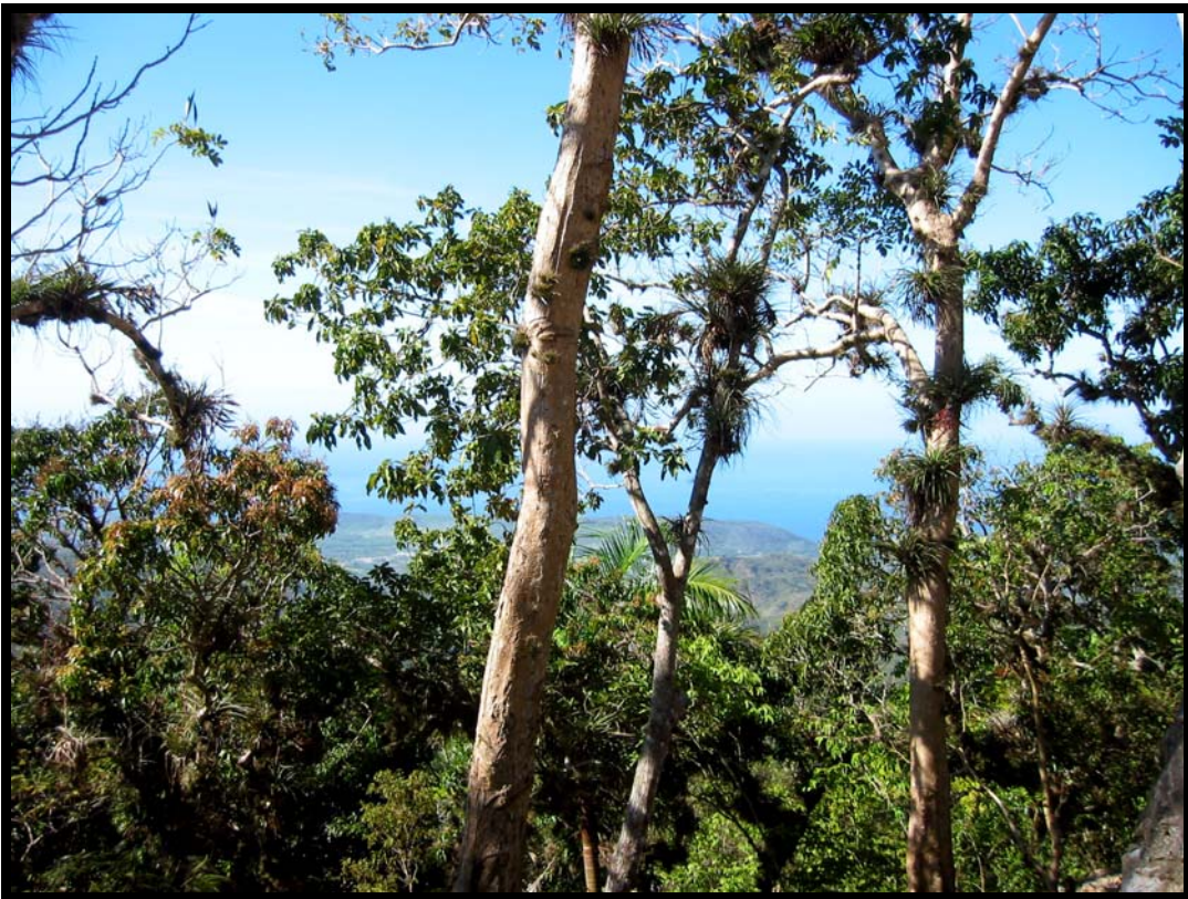
Udsigt fra La Gran Piedra over det caribiske hav