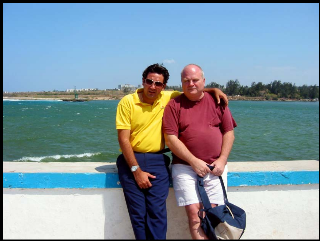
El Commandante og Che