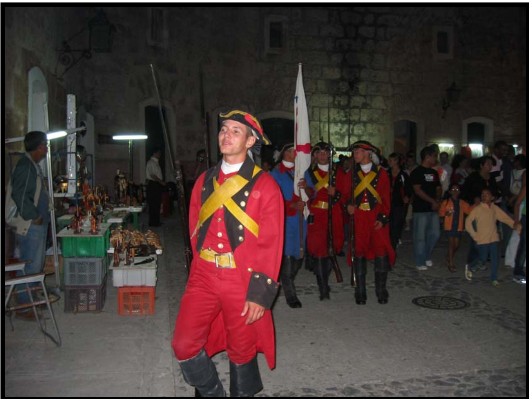
Kanon-ceremoni på fortet ved Havana