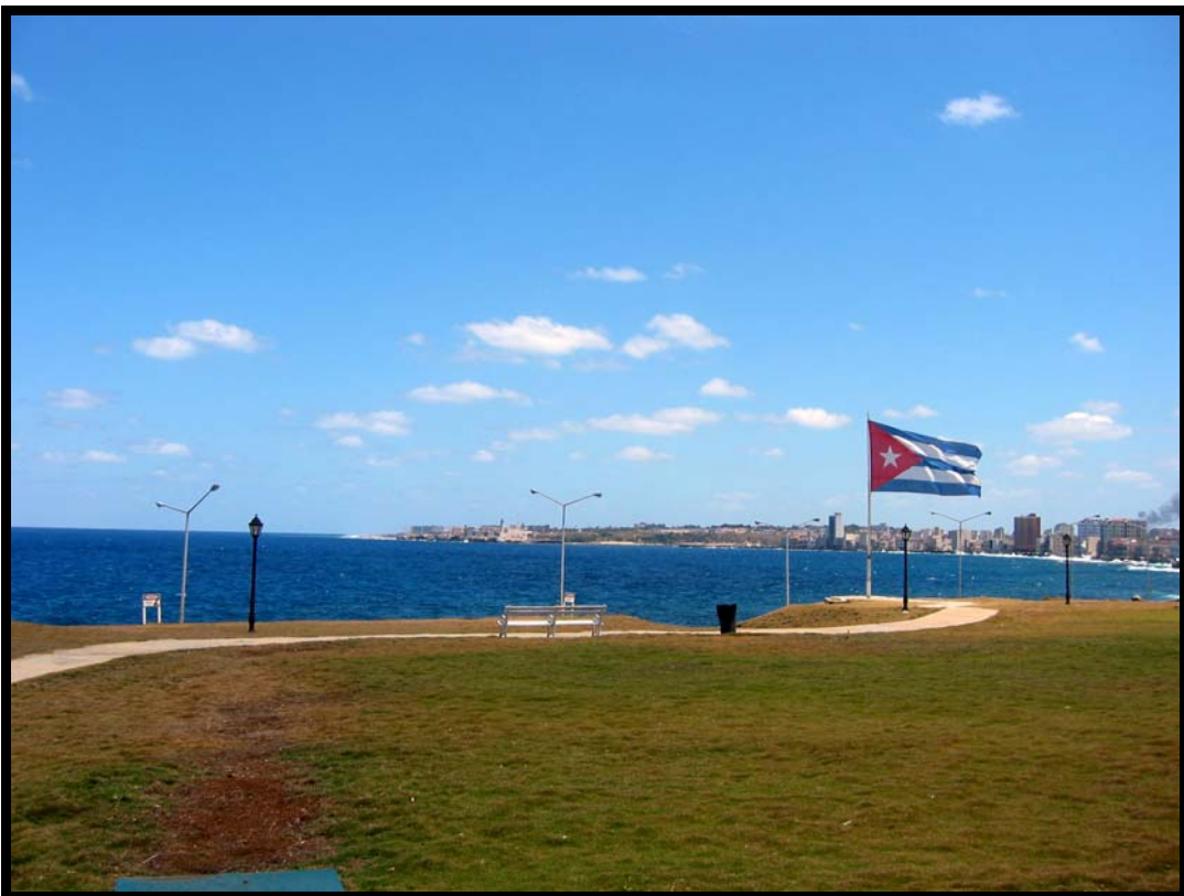
Udsigten fra Hotel Nacional ind mod Old Havana – beskyttelsesrum fra Cubakrisen i 1962 under græsset