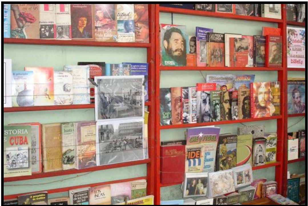
En cubansk boghandel