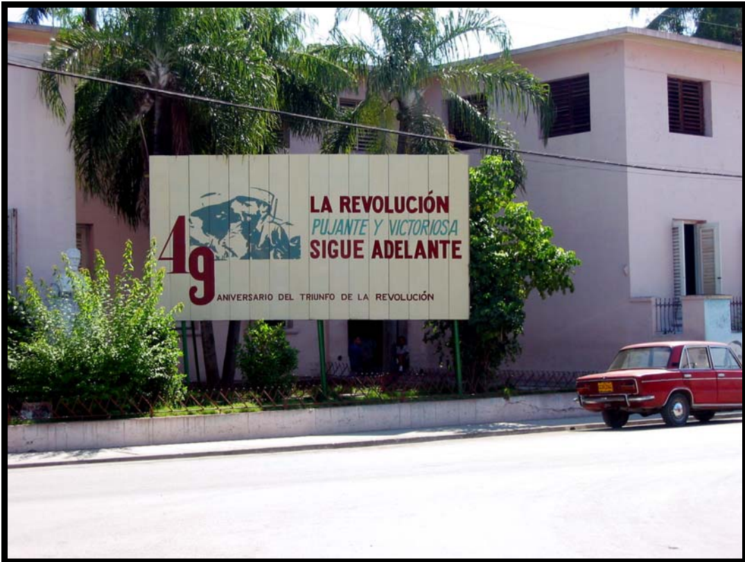
Propaganda i gadebilledet