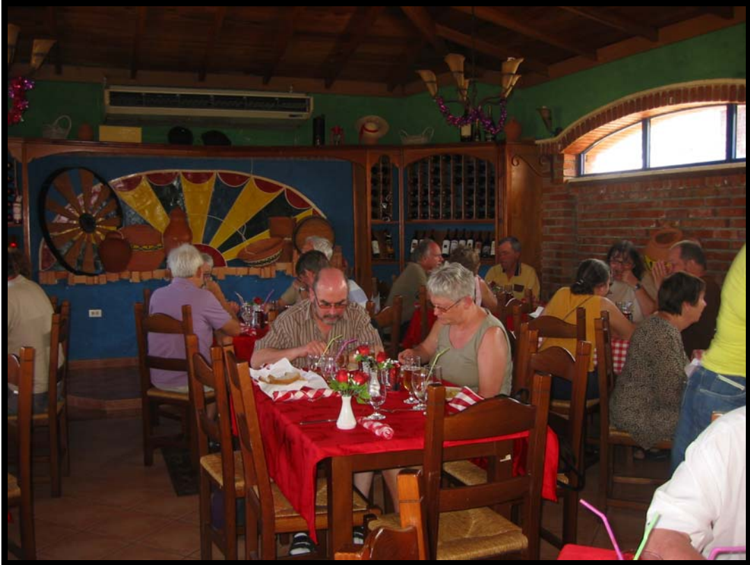
Frokost i Playa del Este