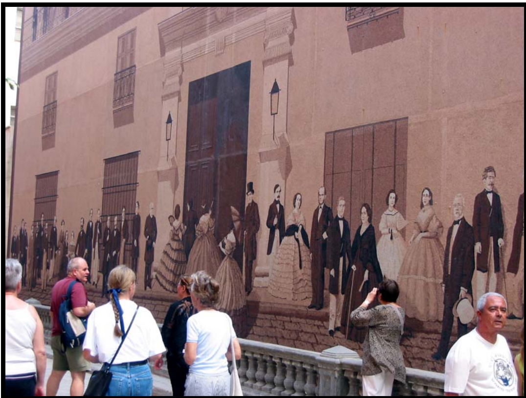
Et vægmaleri i Old Havana