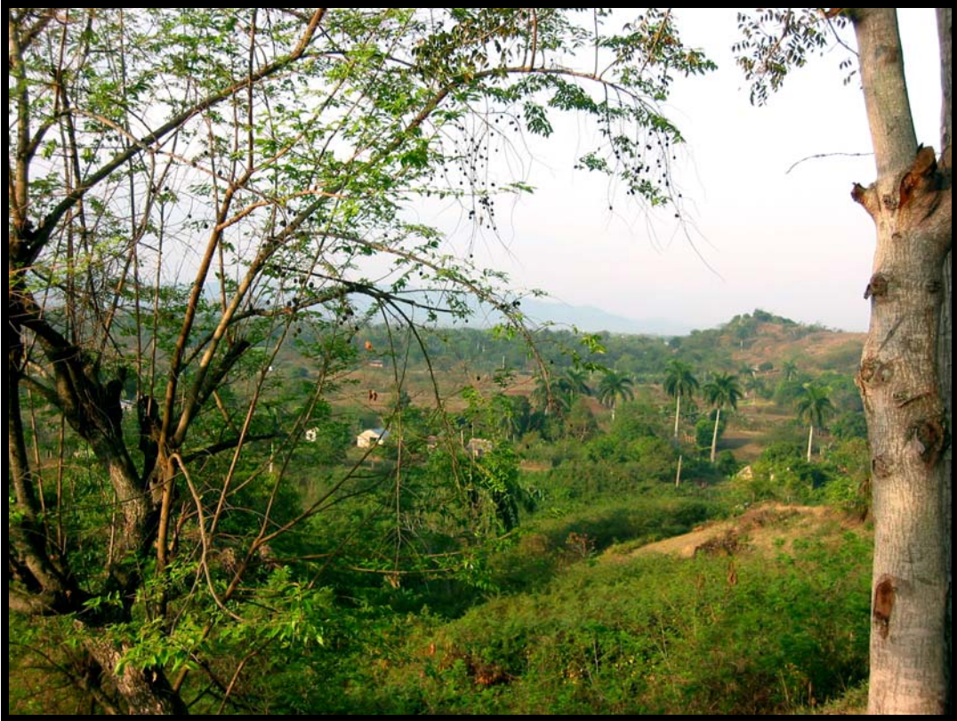
Typisk cubansk landskab