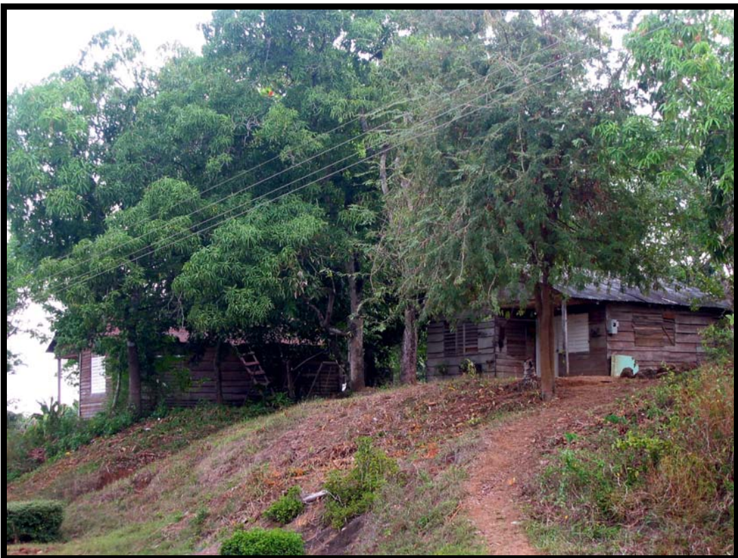
Boliger på landet i Cuba