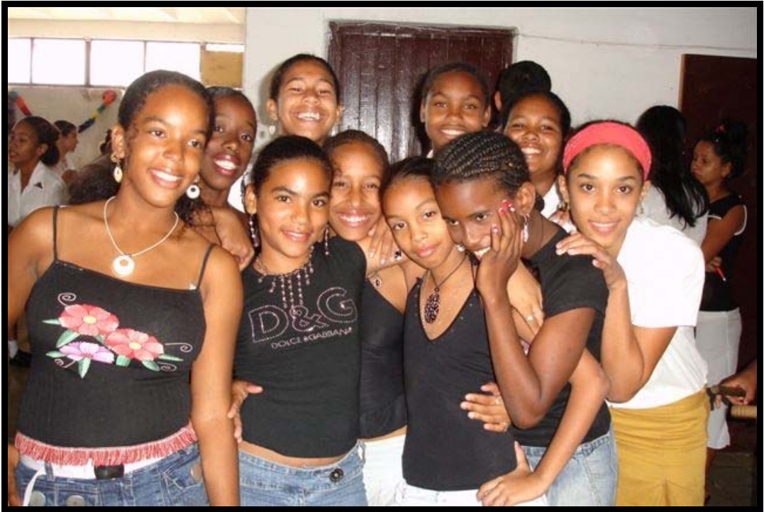
Skolebørn som dansede salsa for og med os