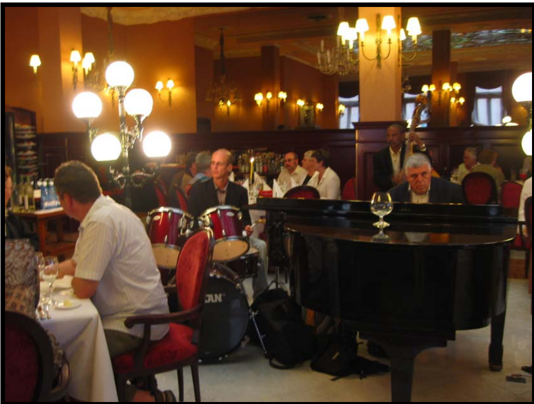
Fra afslutningsmiddagen i Café del Oriente