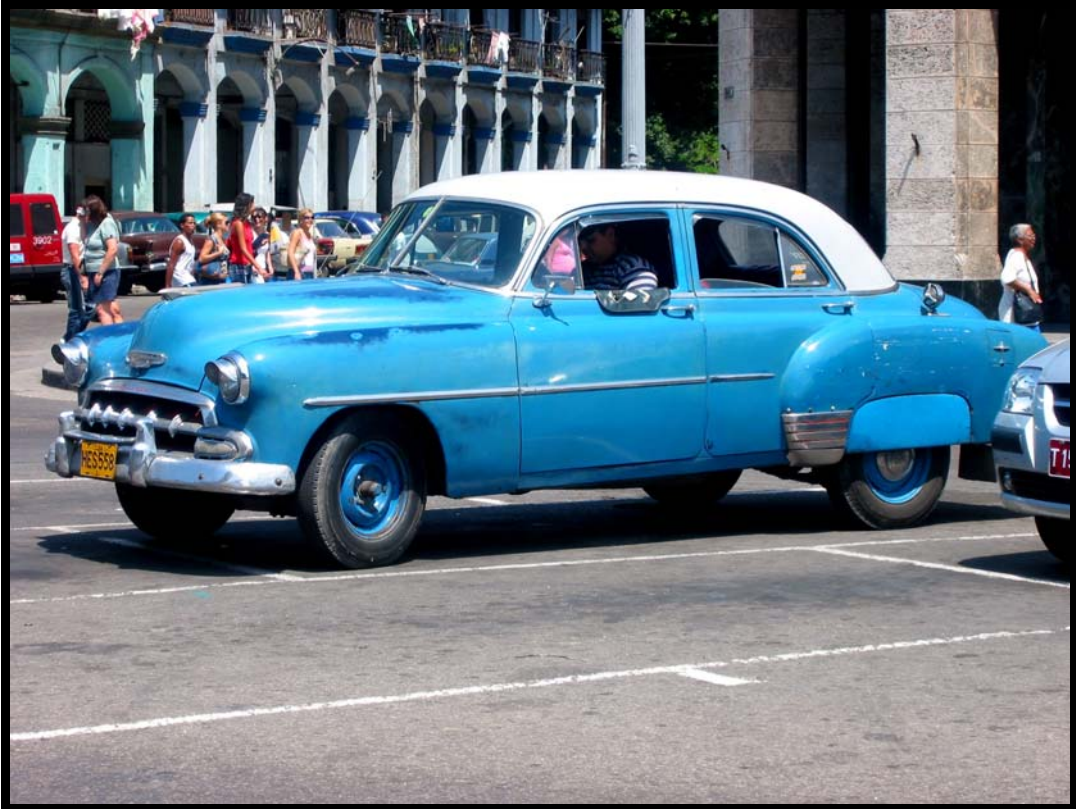
Gammel amerikanebil ved Parque Central