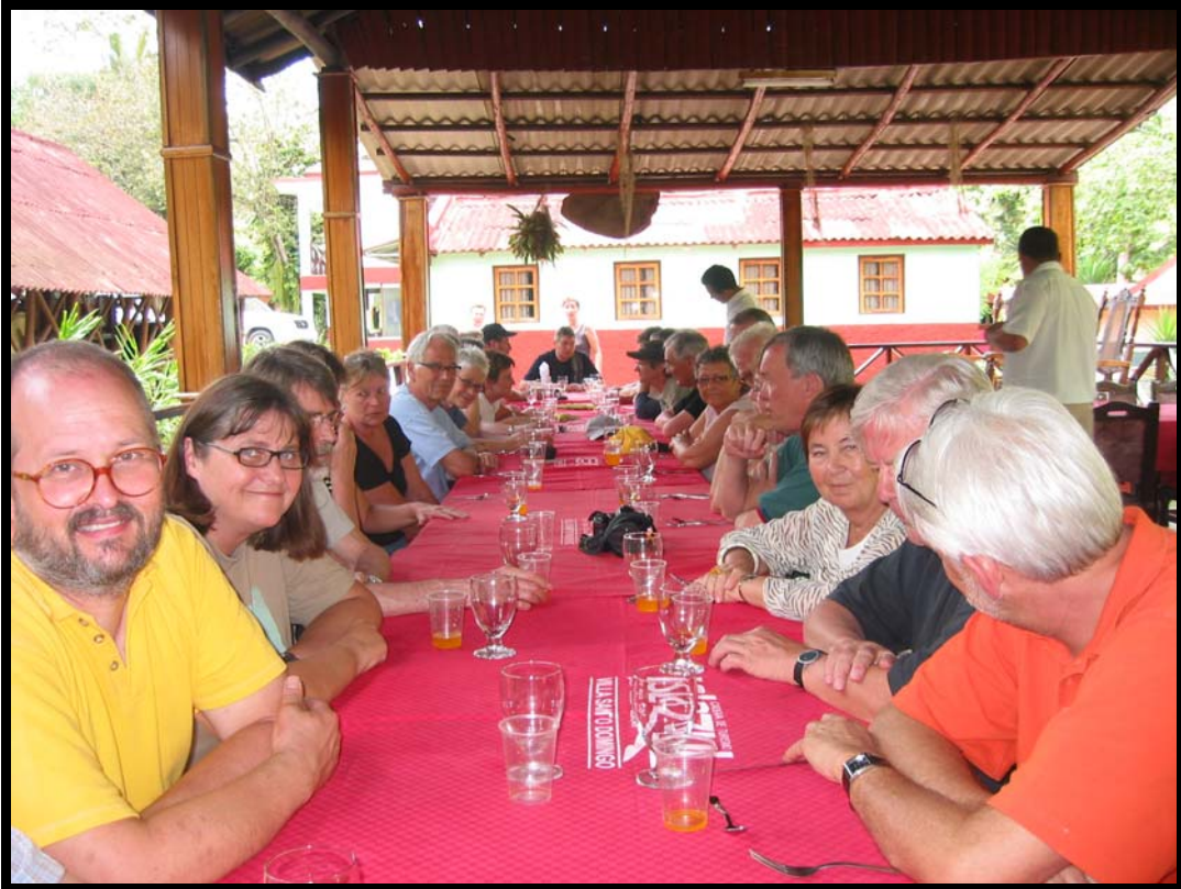
Frokost i Santa Domingo