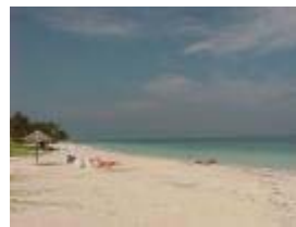
En af Cuba's vidunderlige Strande