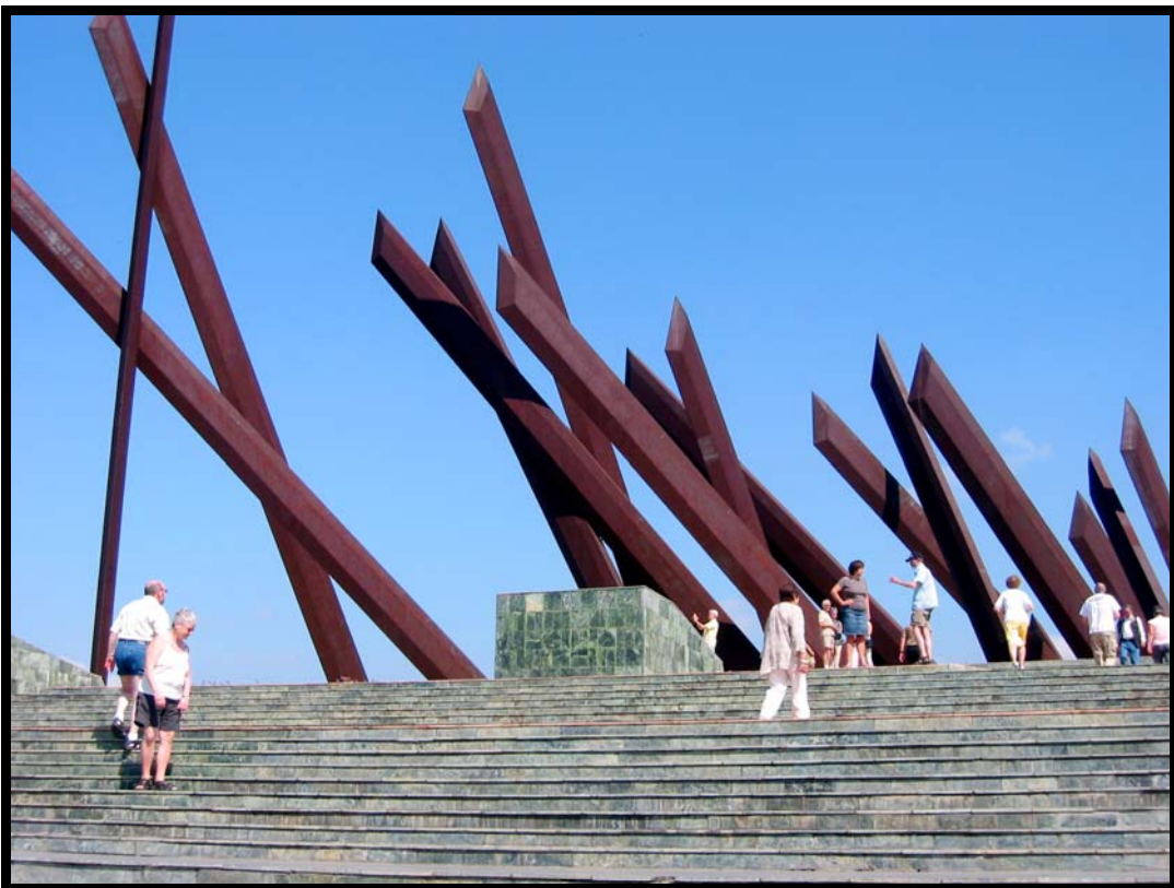
Plaza de la Revolución i Santiago de Cuba med monumentet for general Maceo.