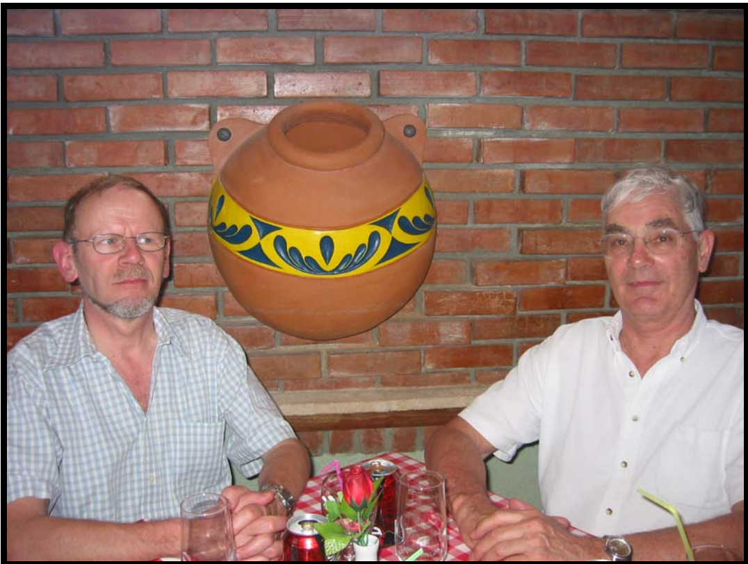
Frokost i Playa del Este