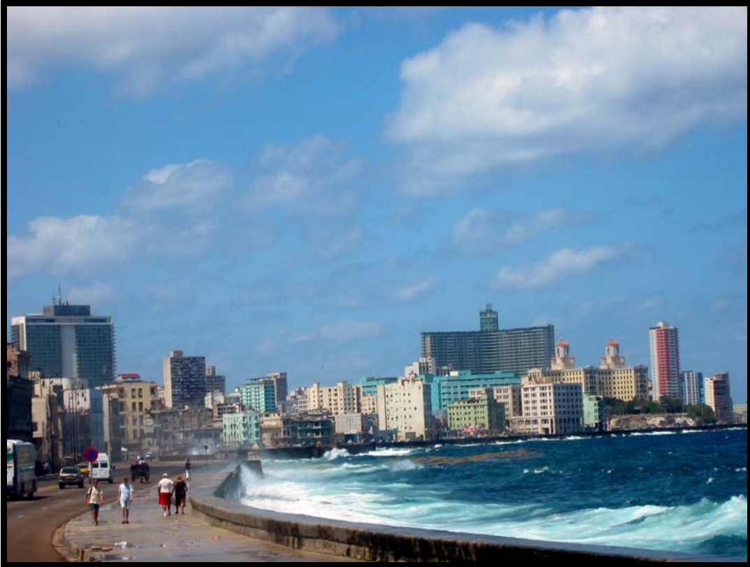
Malecon – havnepromenaden i Havana