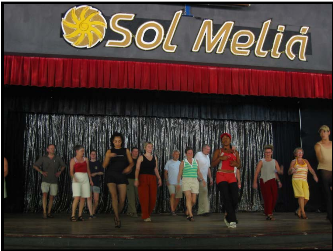
Salsaundervisning i Varadero