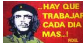
Che Guevare var uddannet læge og led meget af astma