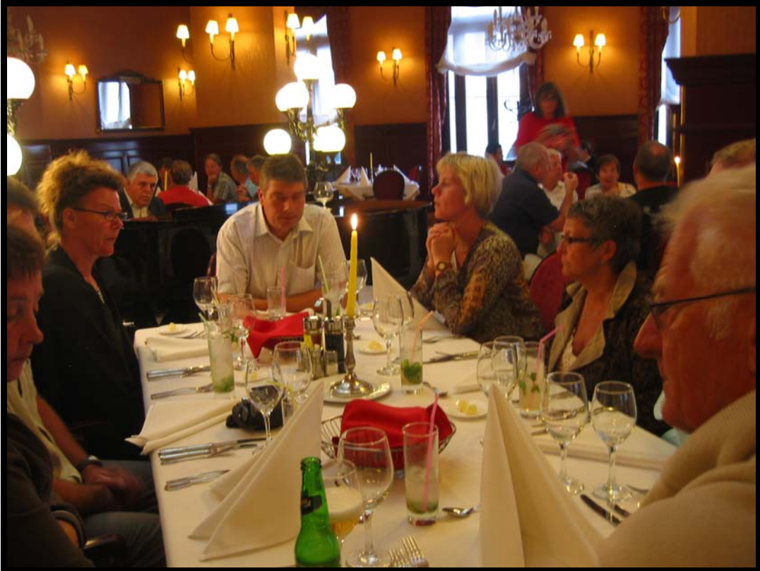
Middag i Café del Oriente