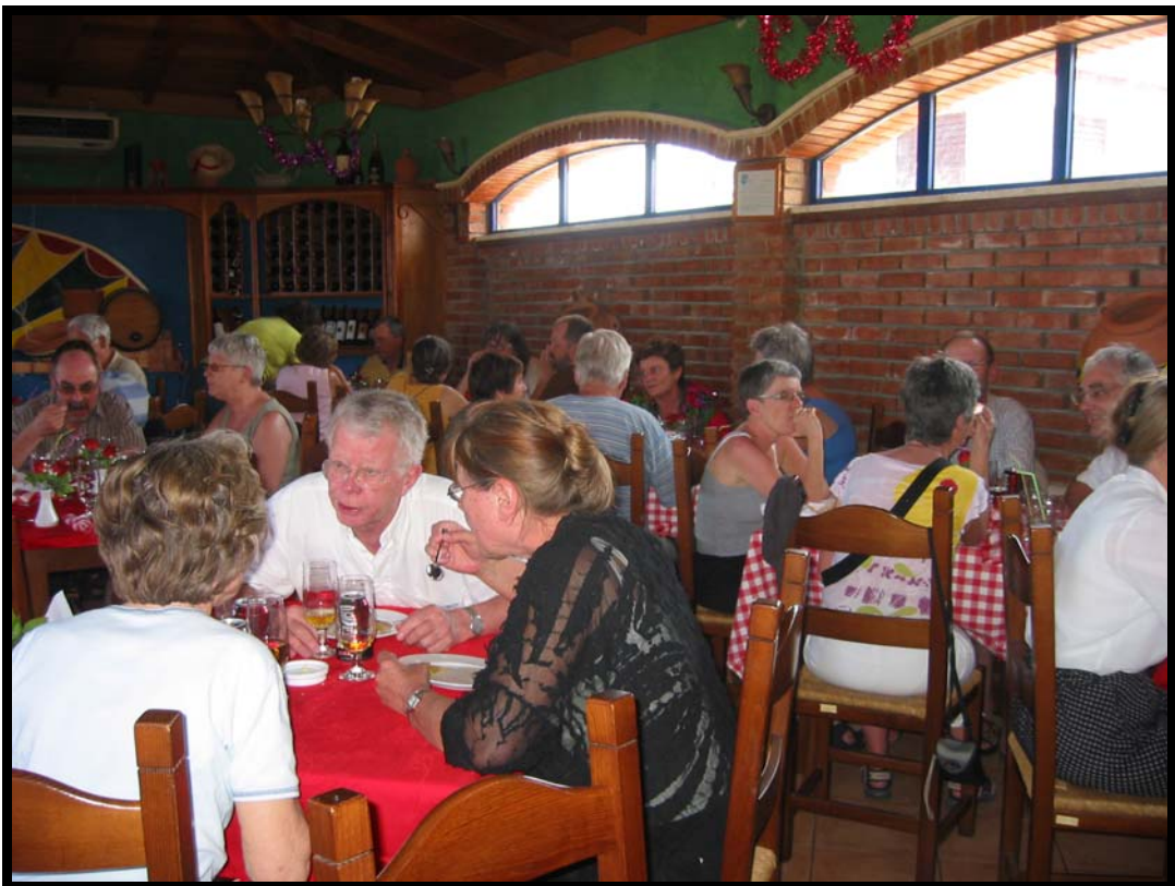
Frokost i Playa del Este