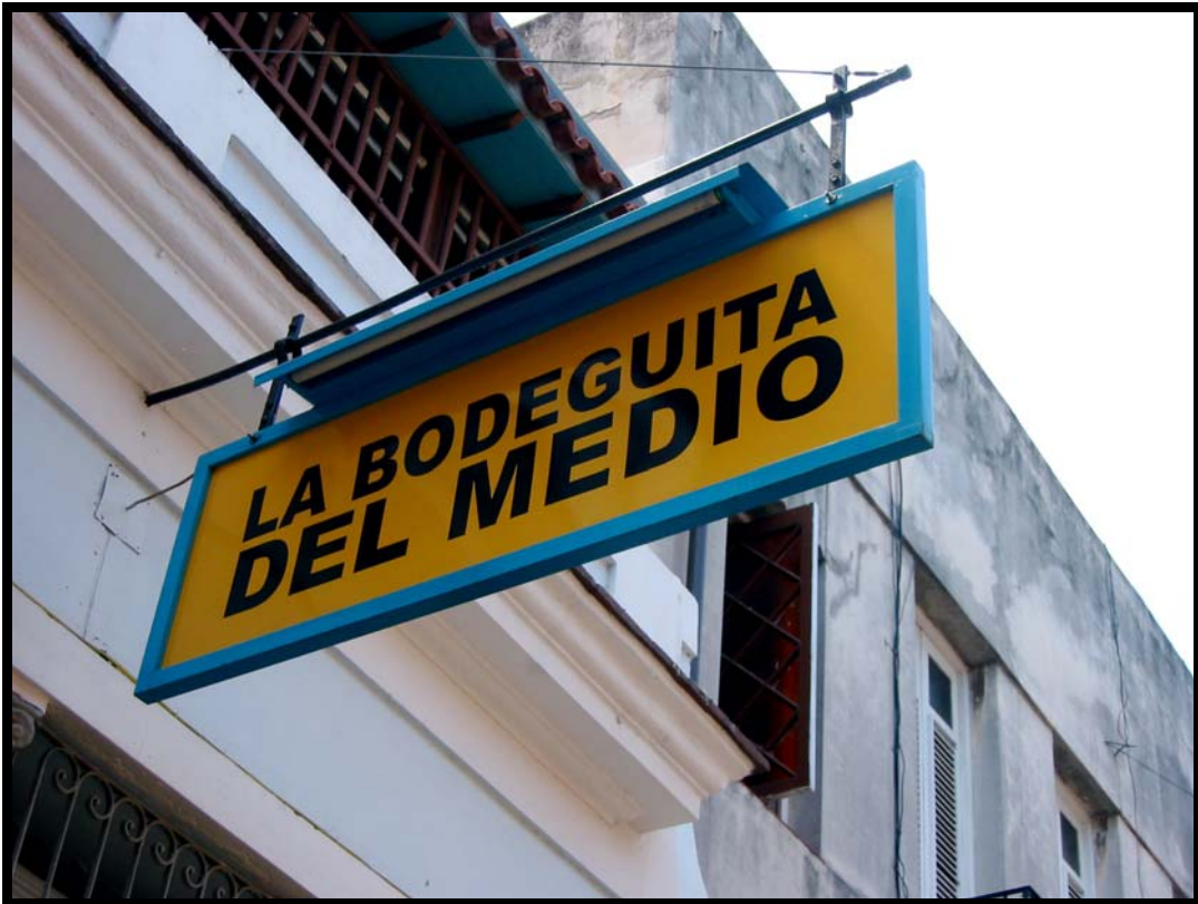
Et dekorativt reklameskilt