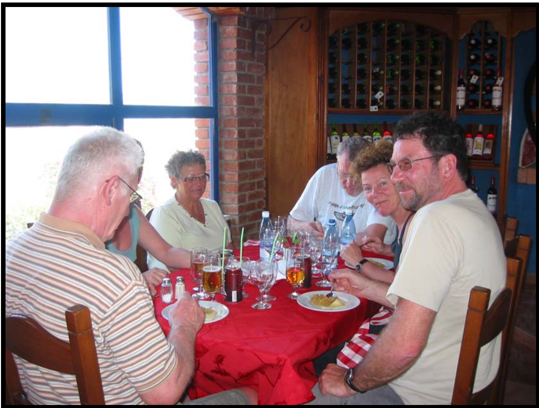
Frokost i Playa del Este