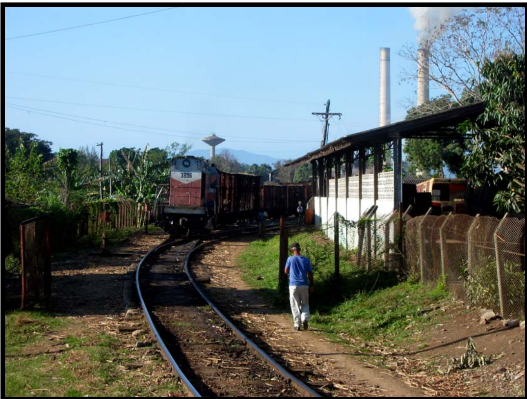
Toget er på vej med sukkerrør til fabriken