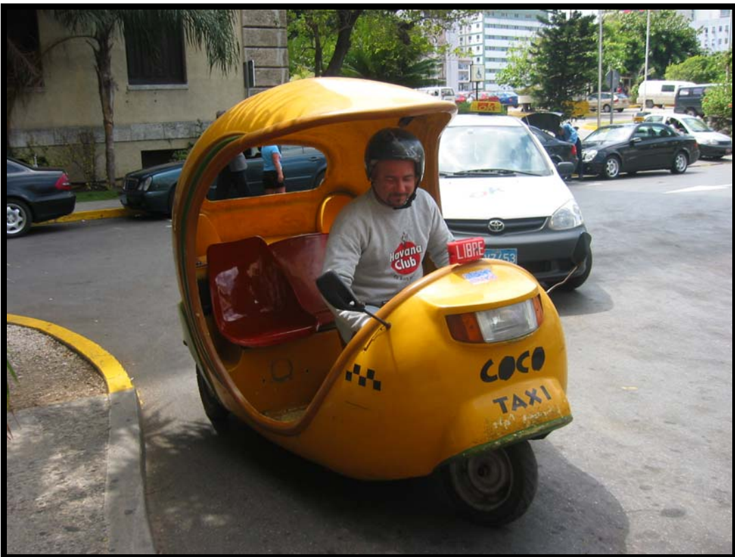
En coco-taxi i Havana