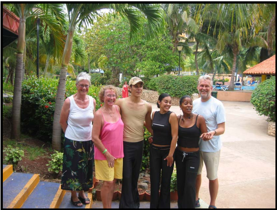
Salsalærerne blev hurtigt populære