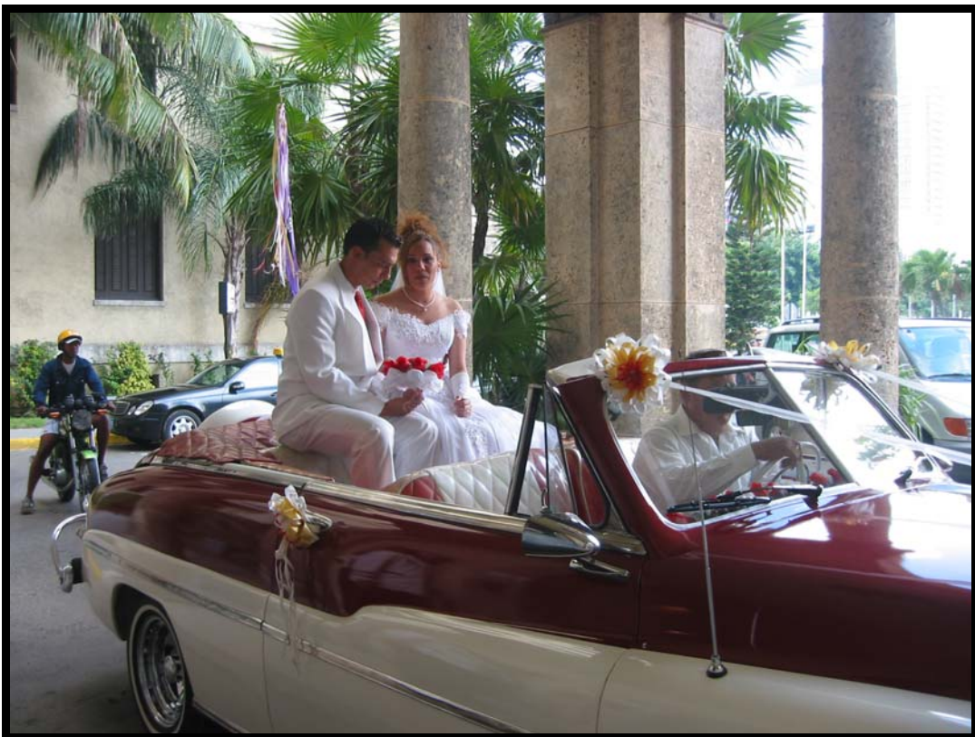
Bryllup på Hotel Nacional