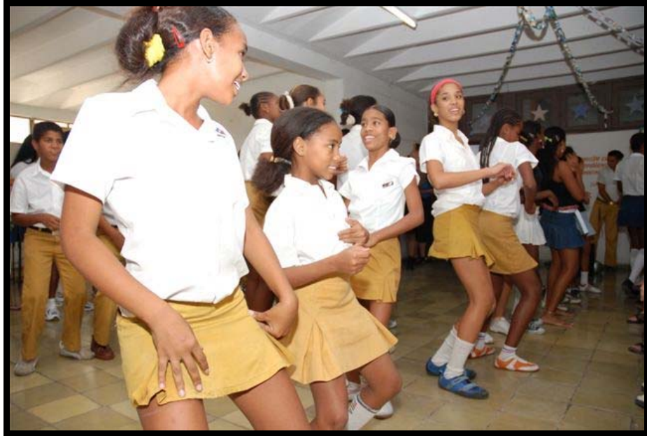
Skolebørn fra 5.klasse underholder os med sang og dans