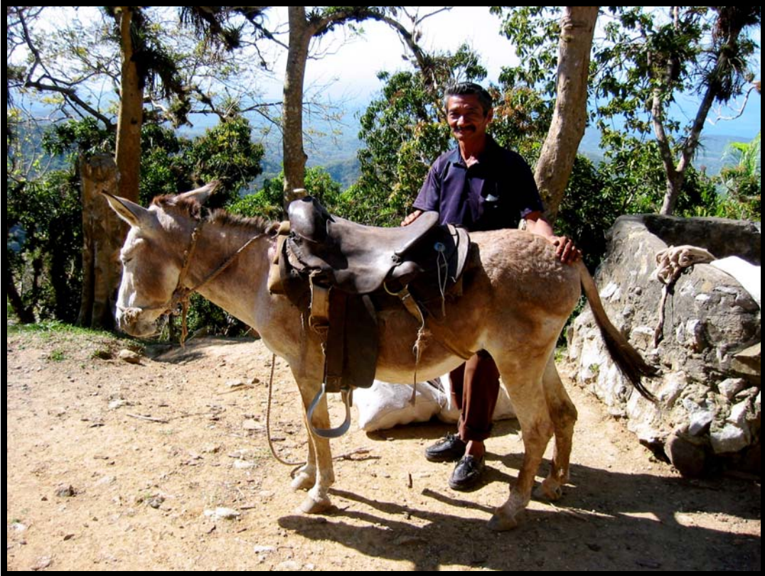
Transportmiddel i bjergene