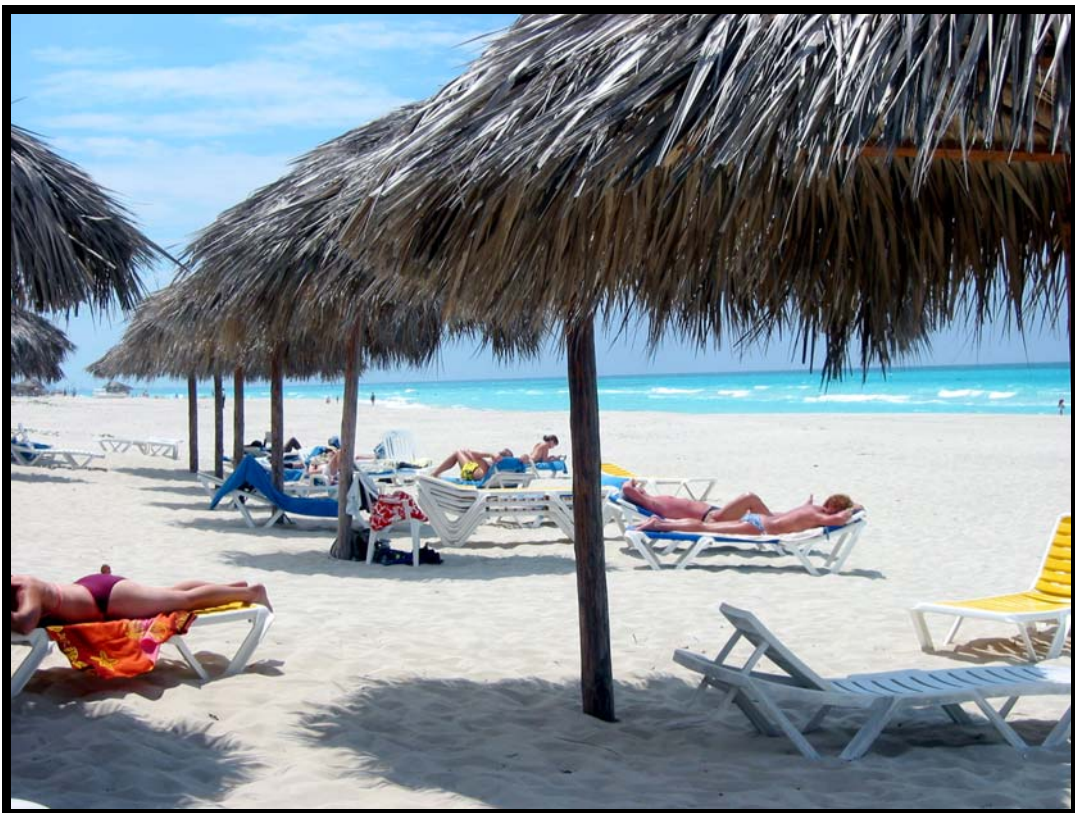
Den meget flotte strand i Varadero