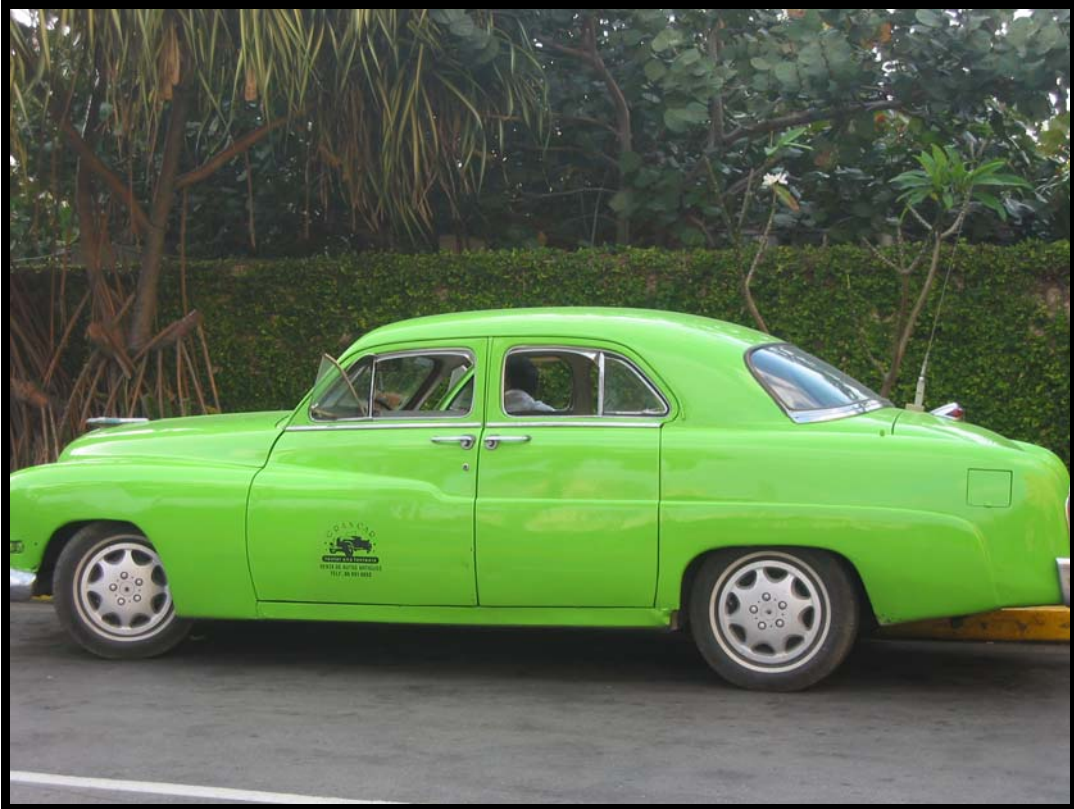
Flot bil i avana