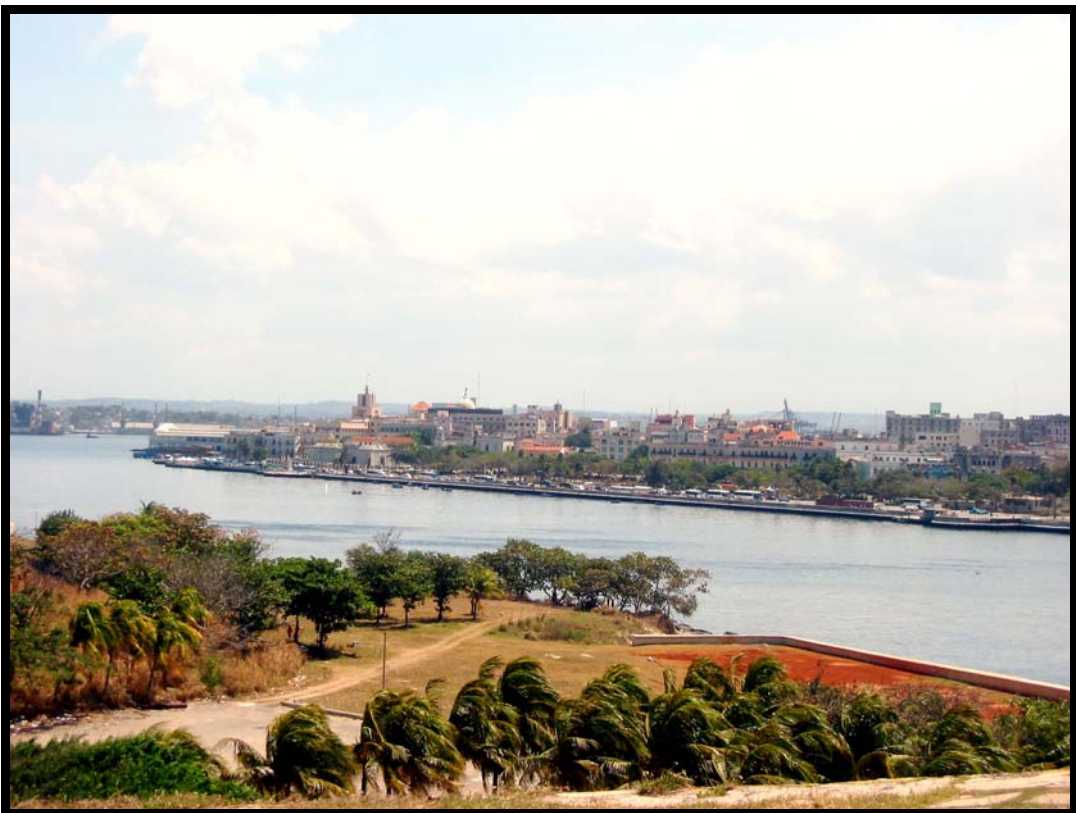
Udsigt fra El Morro over havneindløbet til Havana havn – Old Havana baggrunden