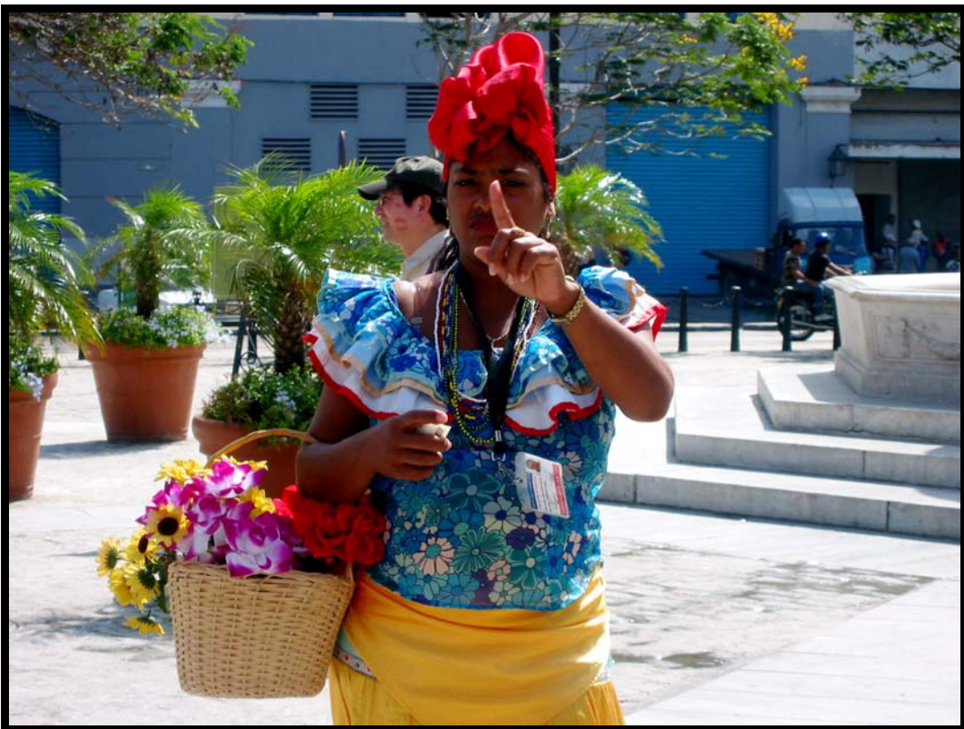
Man kan tjene penge på at være fotomodel!