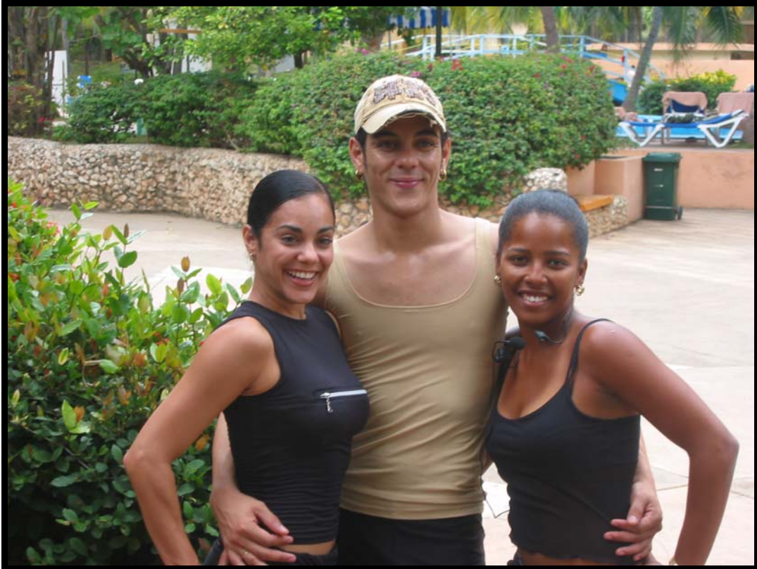
Vore 3 salsainstruktører