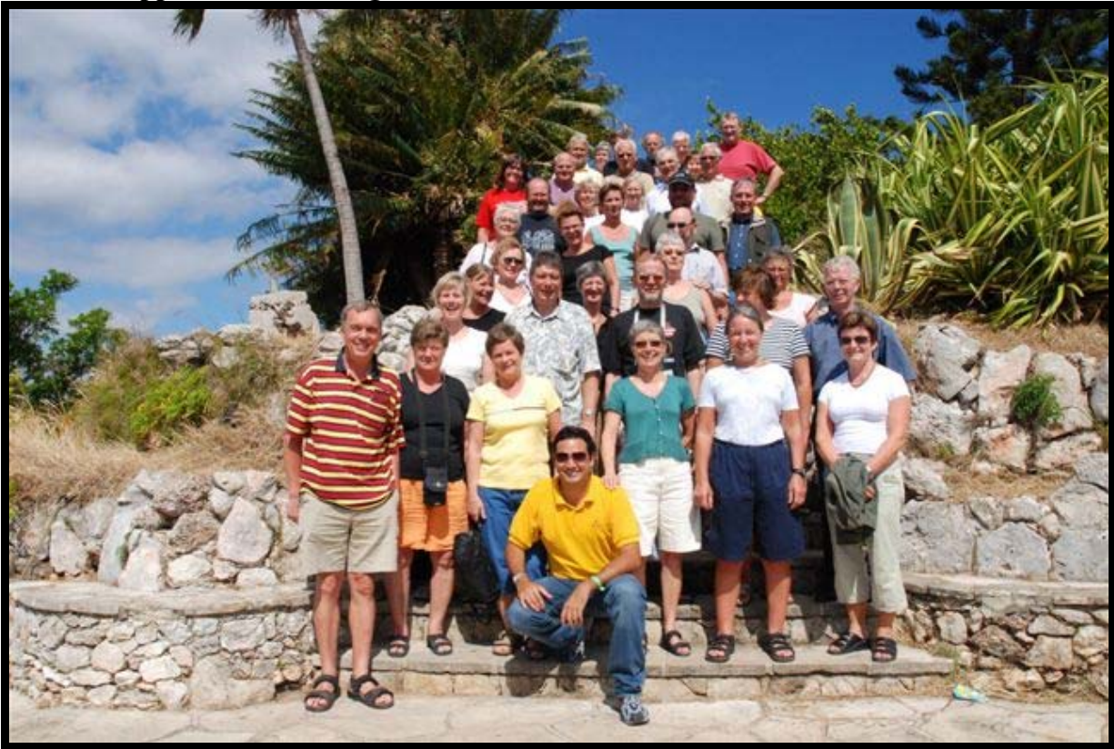
På rejse med DAGENS MEDICIN Vi nyder Cuba's vidunderlige klima