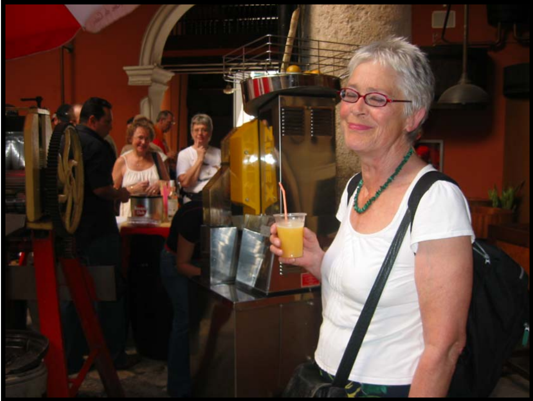
Afprøvning af varene i Rom-museet