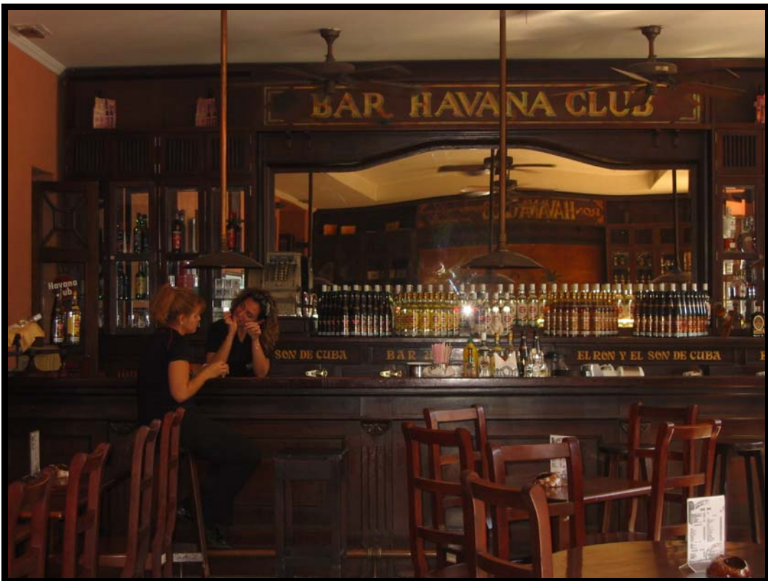
Baren i Rom-museet