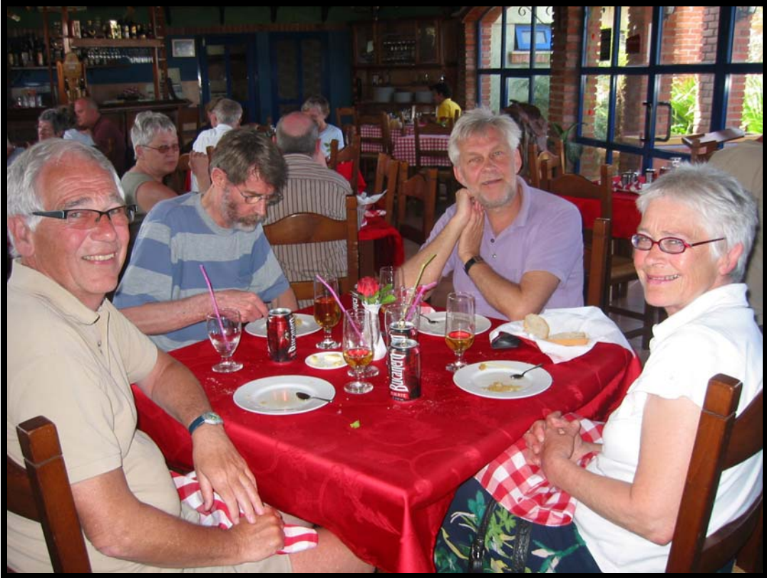
Frokost i Playa del Este