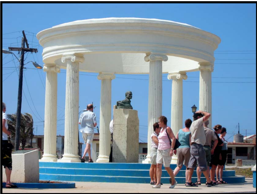
Monument for Hemingway i Cojimar