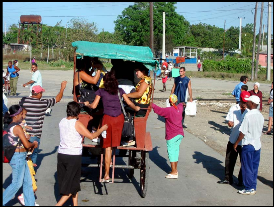
Offentlig transport på Cuba