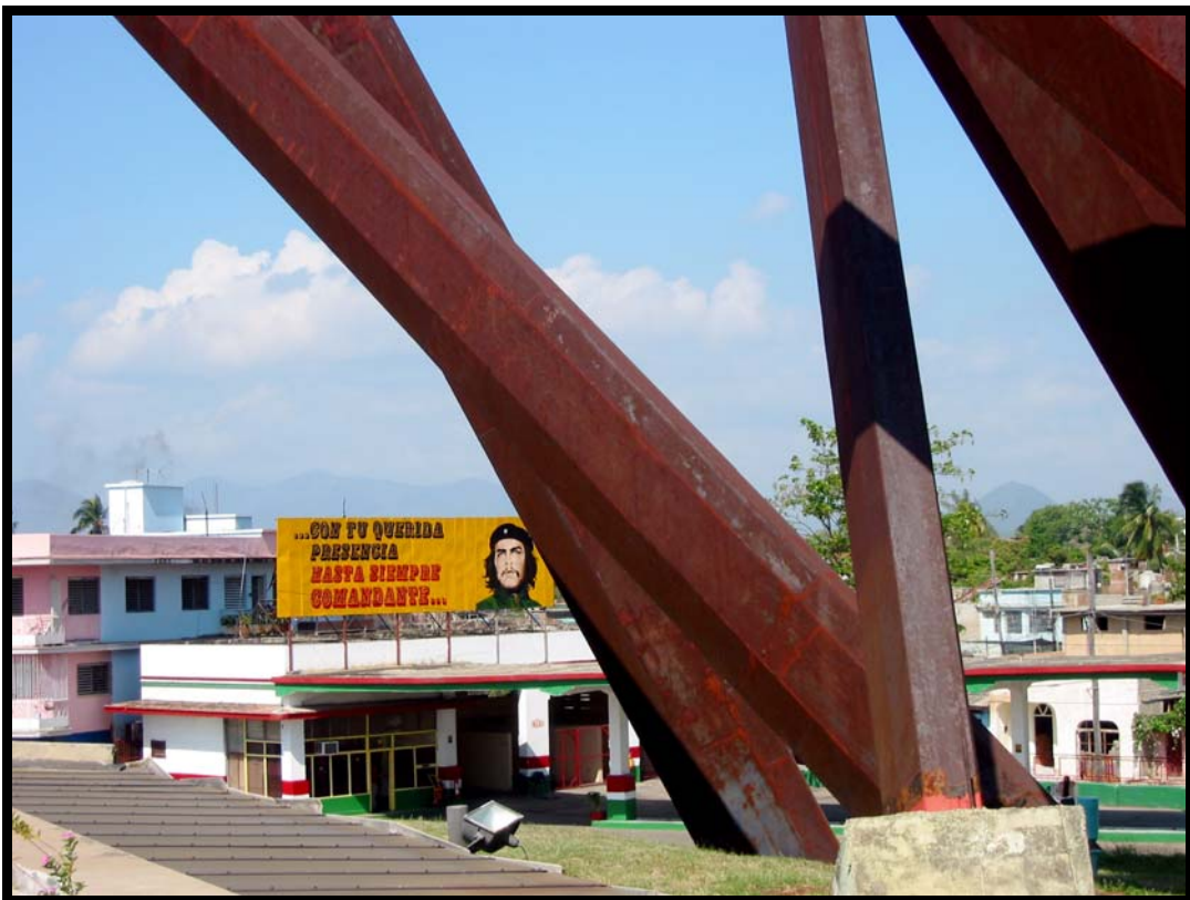
Che Guevara er også med på Plaza de la Revolución