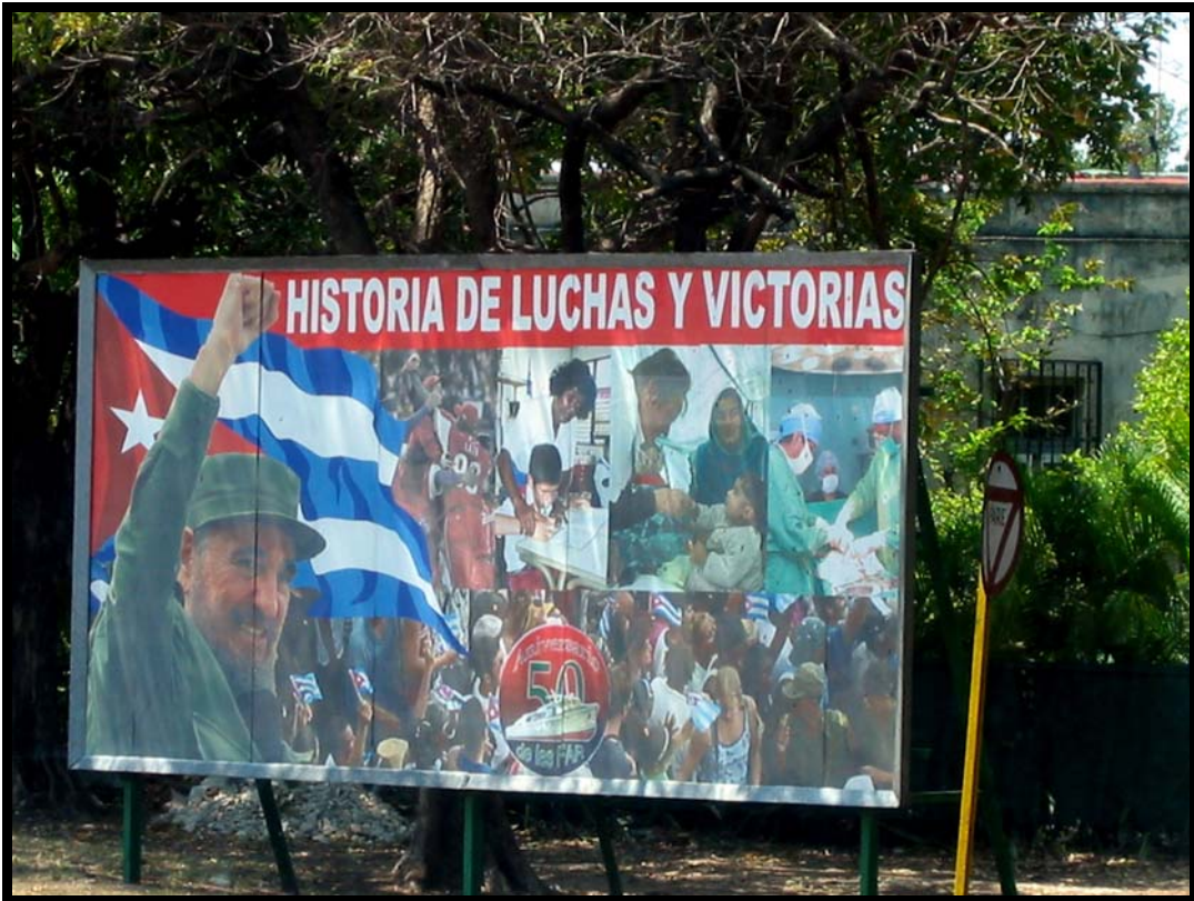
En hilsen fra Fidel