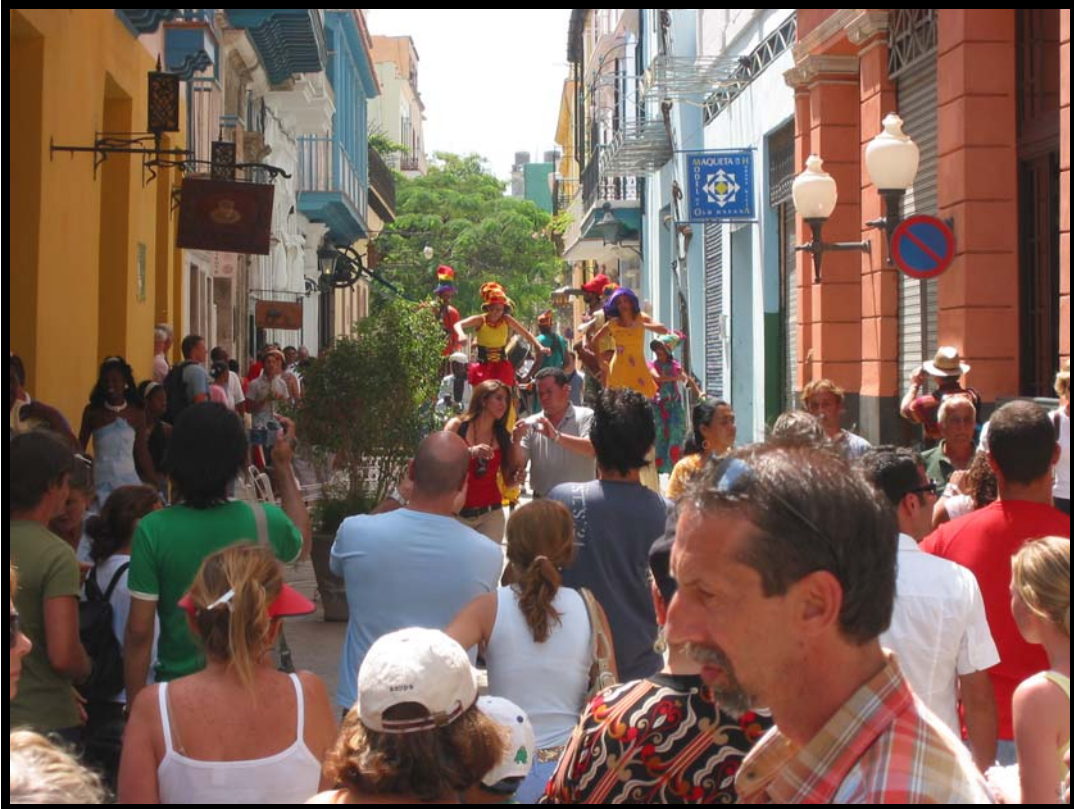
Folkeliv i Calle Obispo ved Hotel Ambus Mundus