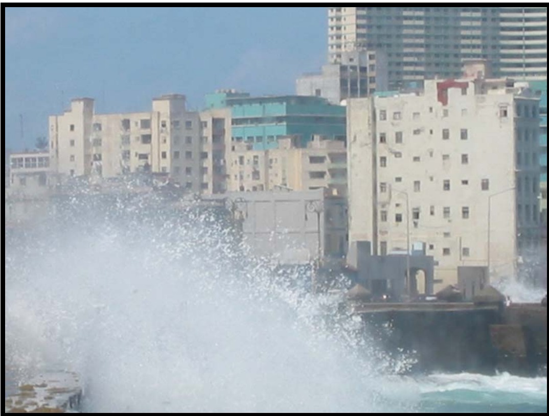
Bølgerne slår ind over Malecon