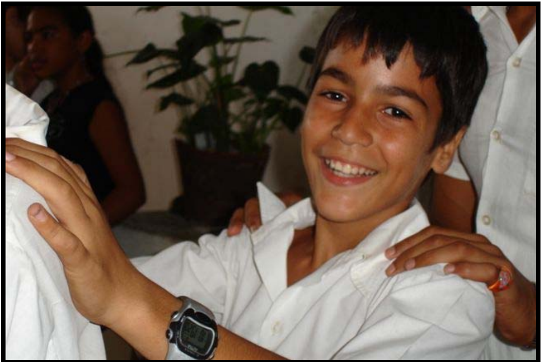
Drengen som var dygtig sanger og guitarist