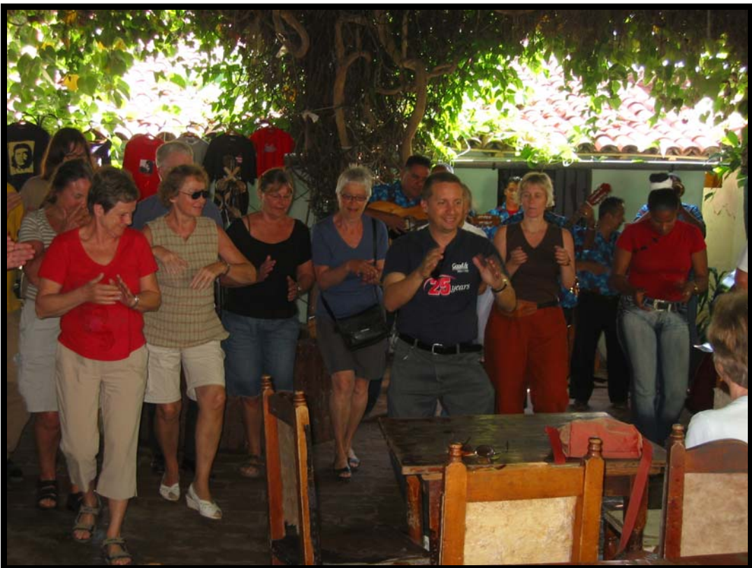
God danselærer og lærevillige elever