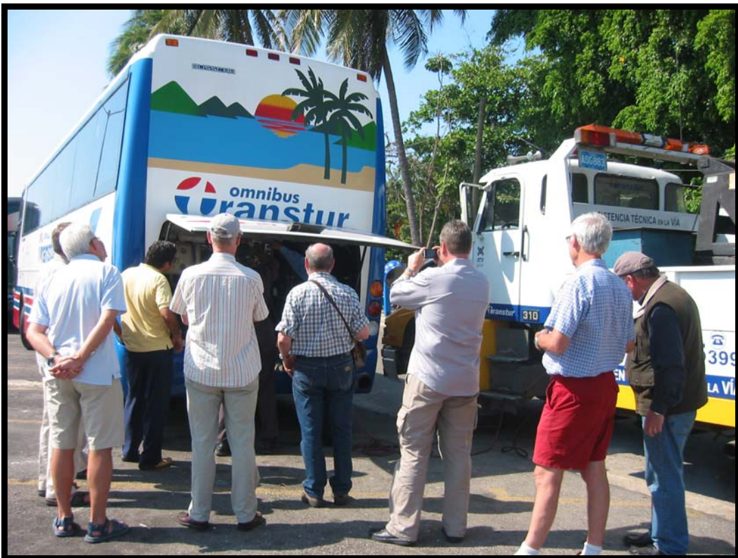
På vej til lufthavnen – det er altid klogt at være i god tid!