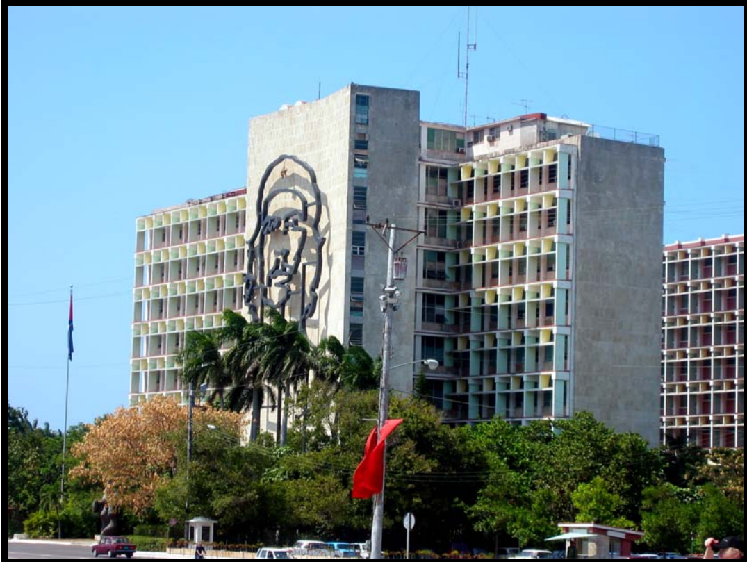
Indenrigsministeriet på Plaza Revolution med det store portræt af Che Guevara