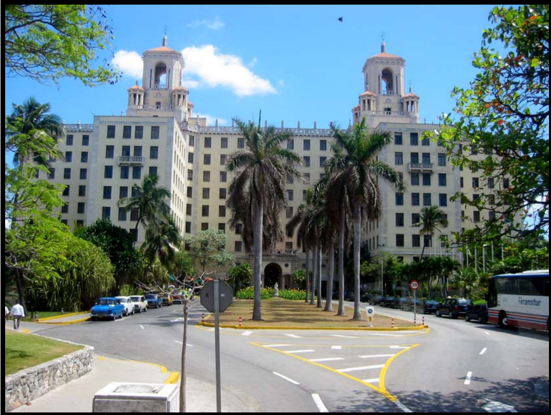
Hotel Nacional i Havana