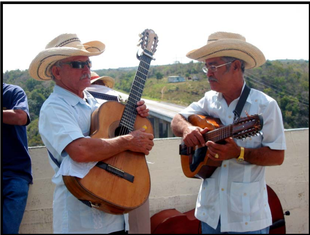
Der var stort set ikke et måltid uden underholdning af cubanske musikere