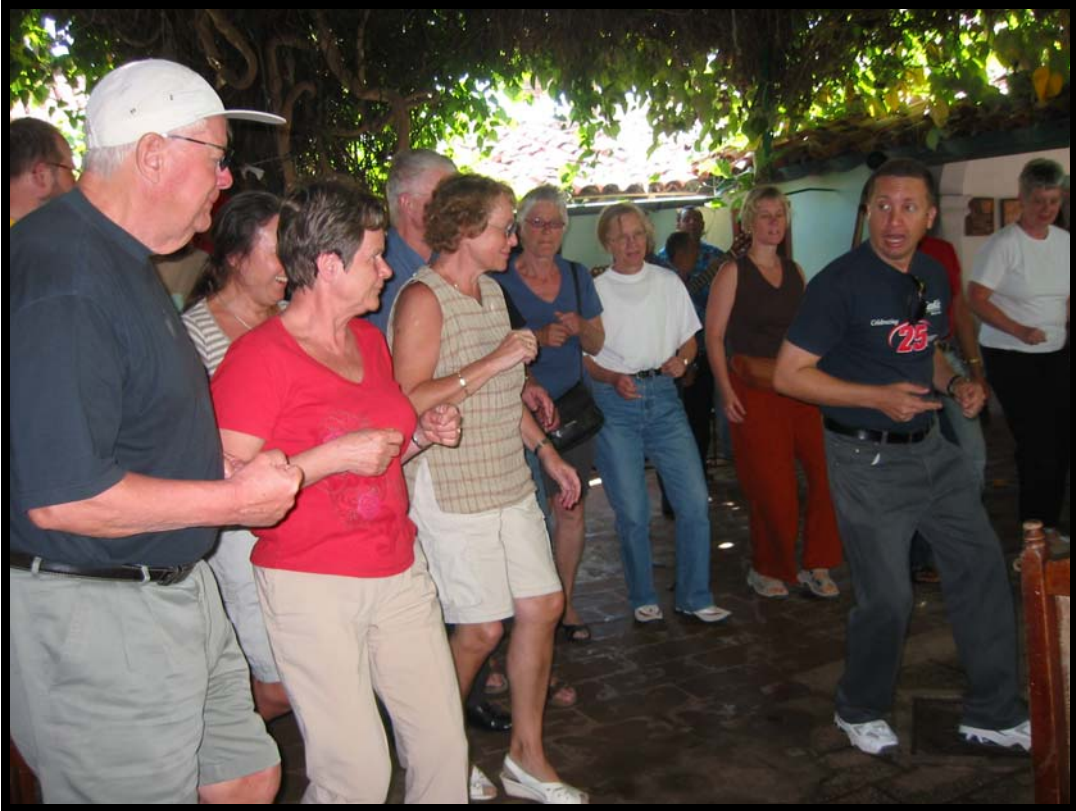
Salsa i Bayoma