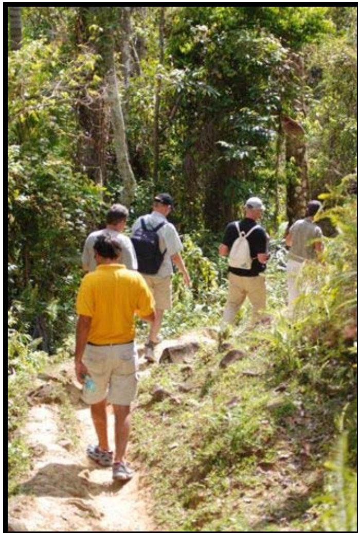
På vandring op mod Hospital Guerilla