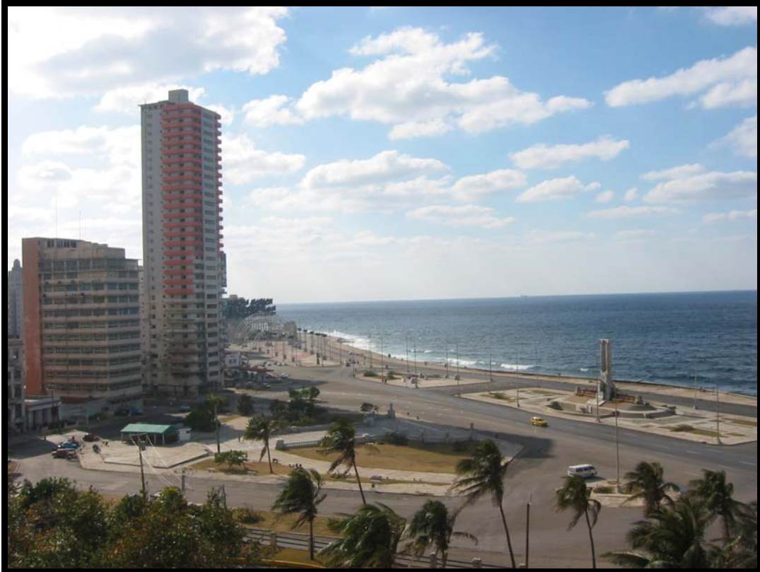
Malecon med Maine-monumentet – Det amerikanske Interessekontor i baggrunden bag de sorte flag