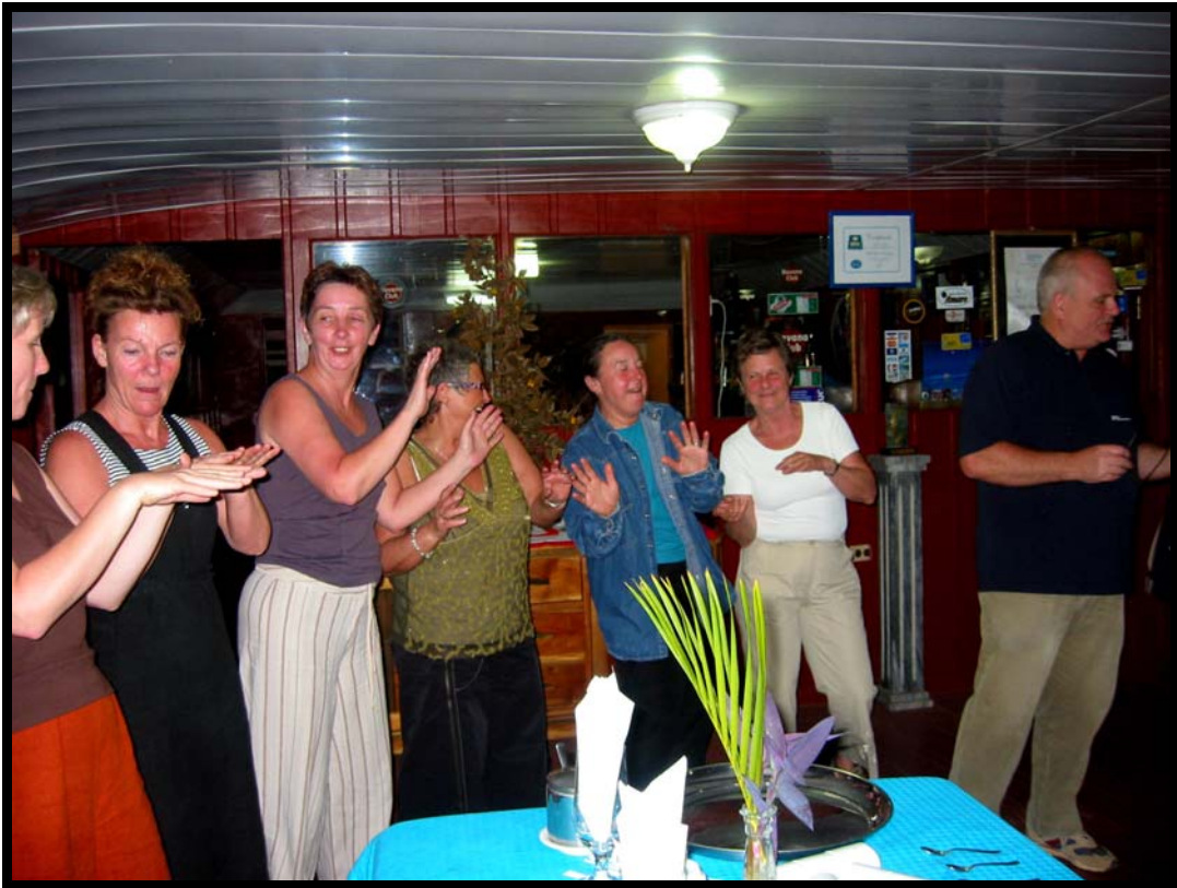
Underholdning om aftenen i Villa Santa Domingo – vi forsøger med "My way"