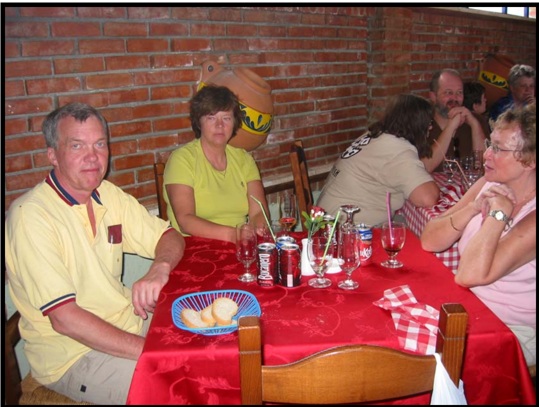
Frokost i Playa del Este