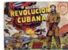
Fra en cubansk skolebog