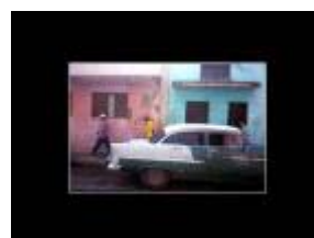
Gadebillede fra Havanna