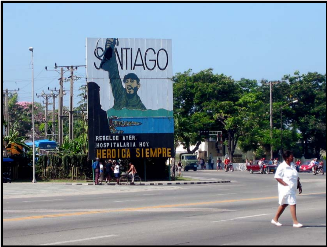
Typisk gadebillede i Santiago de Cuba