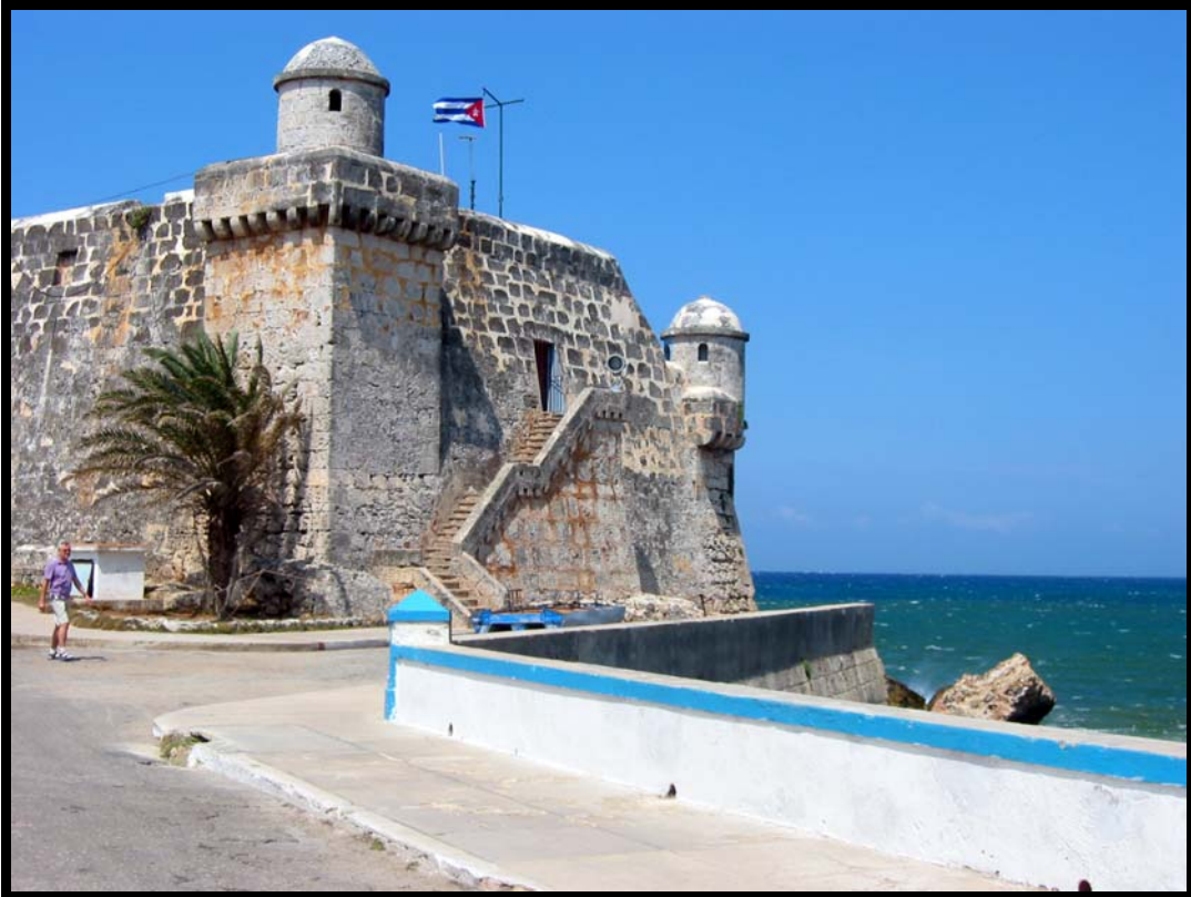
Fra fiskerbyen Cojimar