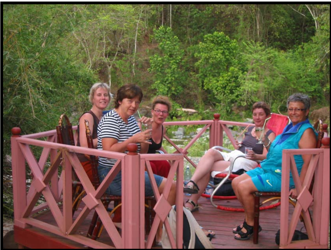
Eftermiddagshygge i Villa Santa Domingo