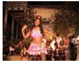
En cubansk danserinde fra Santiago de Cuba