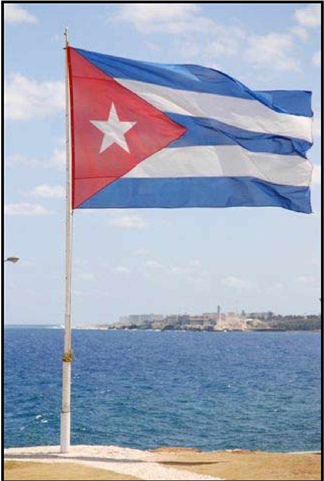
Farvel til Cuba for denne gang