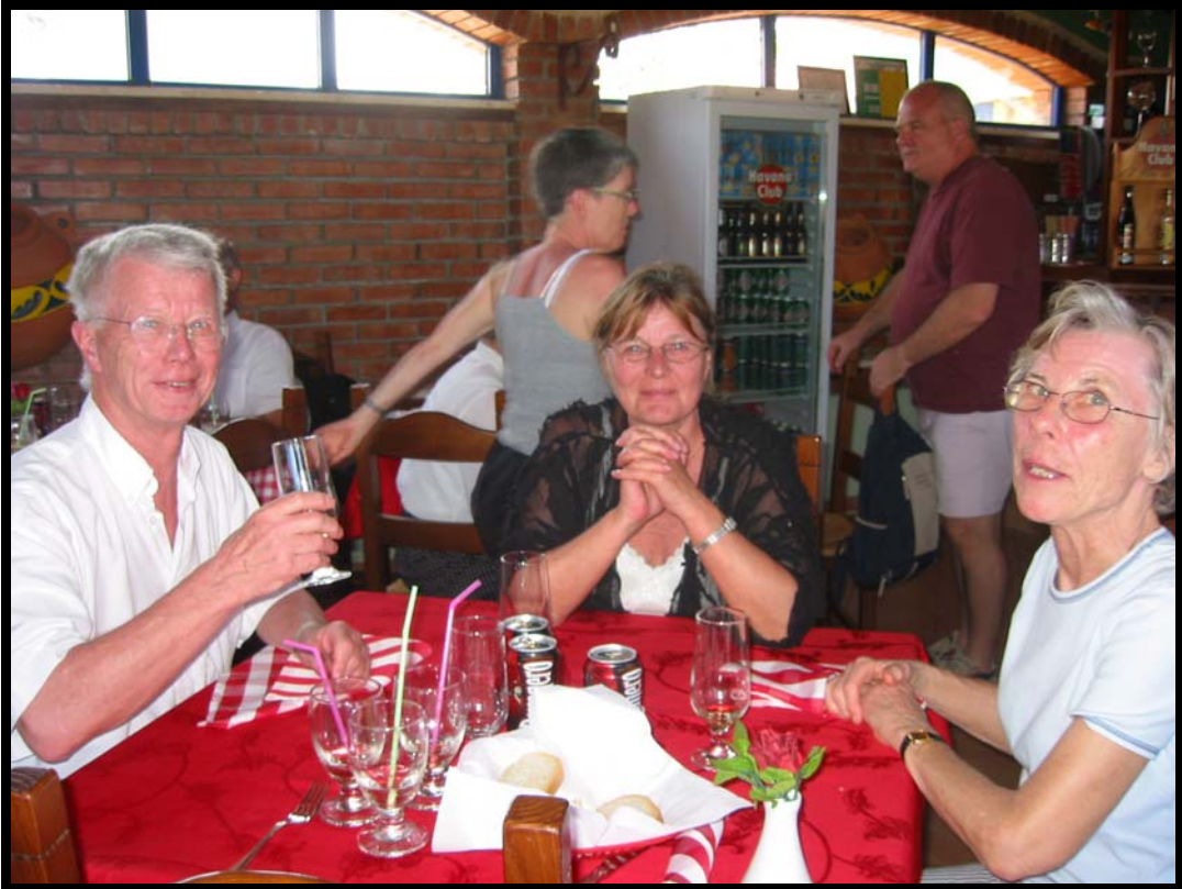
Frokost i Playa el Este