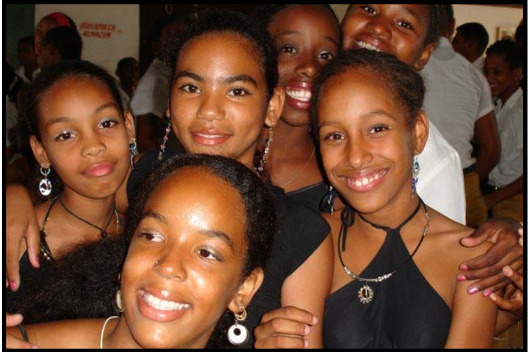
Skolepiger på 26.juli skolen