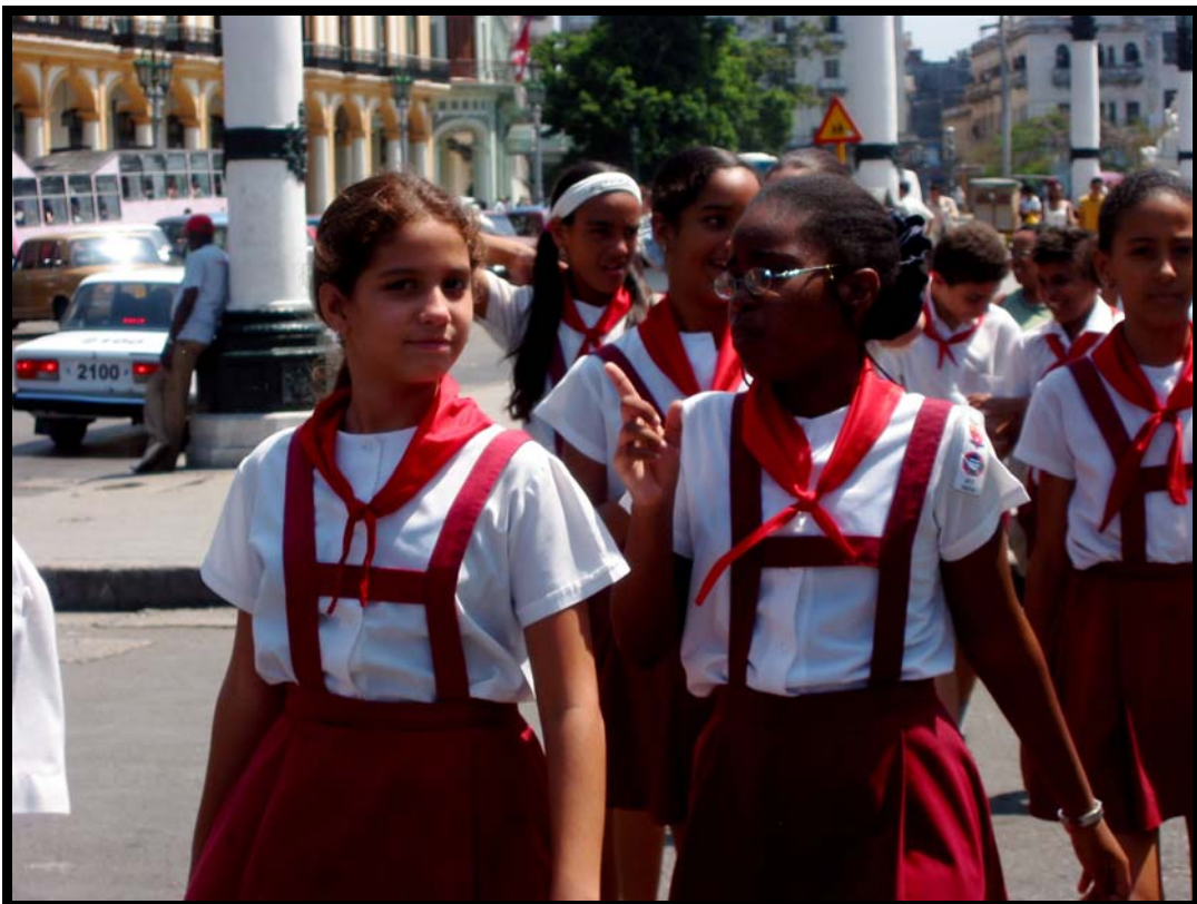
Skolebørn på tur i Havana