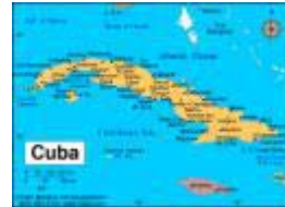
Santiago de Cuba ligger helt i øst, mens Havana ligger næsten ved øens nordligste punkt