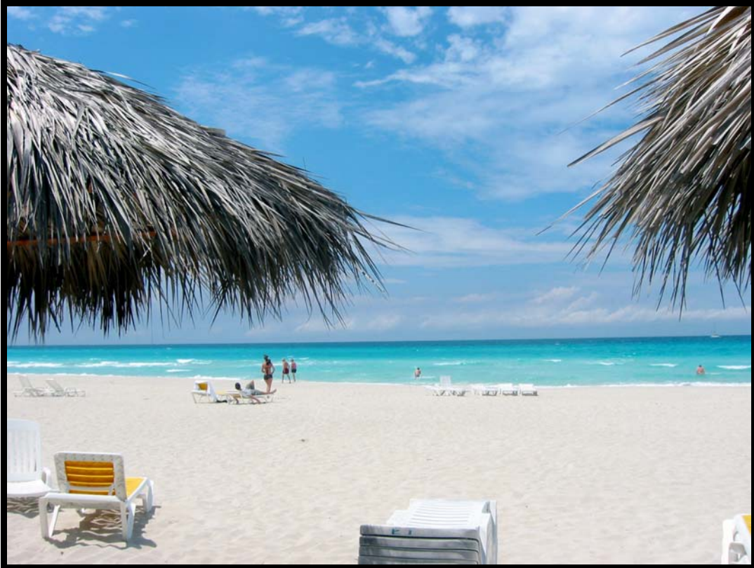
Martin på vej ud i vandet i billedets højre side